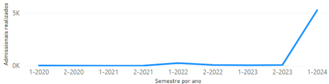
Gráfico 4 – Exames admissionais realizados por semestre (2020-2024)

Fonte: dados extraídos do SISAP pelo NEADP/SEPLAG.